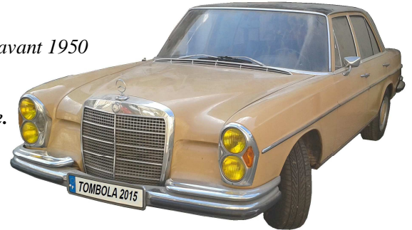
Gros Lot Mercedes 280S BA de 1972

Pour tout renseignement : Paul BARBARY 06 67 39 92 32 ou Bernard DEBRYE 06 70 36 17 91