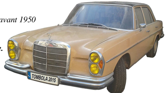
Gros Lot Mercedes 280S BA de 1972

Pour tout renseignement : Paul BARBARY 06 67 39 92 32 ou Bernard DEBRYE 06 70 36 17 91